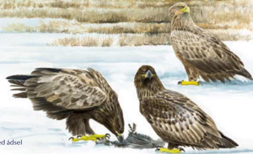
Havørne ved ådsel

Vandrefalken er fast inventar på Nyord Enge året rundt. Ofte sidder den og spejder efter bytte fra en af hegnspælene på de sydlige enge, undertiden så tæt på fugletårnet at den kan iagttages med en håndkikkert. Vandrefalkens føde består af duer, krager og ænder, som den nedlægger med stor præcision og i høj fart.